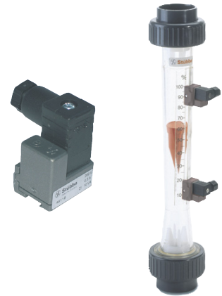
Débitmètre équipé de micro-contacts