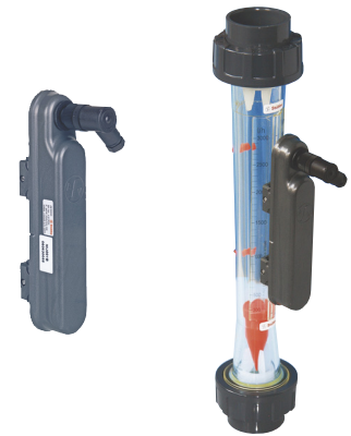
Débitmètre équipé du transmetteur 4-20mA ZE3000

Pour le montage de plusieurs débitmètres observer une distance >200mm pour DFM 165 à 200 >400mm pour DFM 350